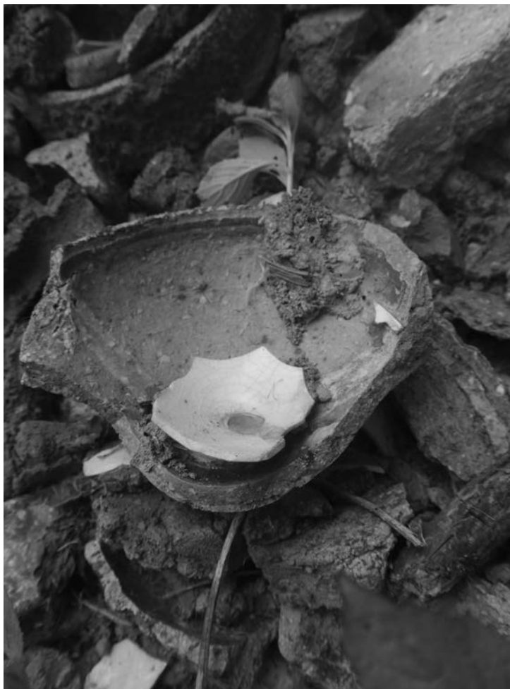
Gaceta refractaria con un trozo de porcelana dentro, Jingdezhen, 2012.

montículo de desechos, descuidado pero discreto, sino todo un paisaje de porcelana.