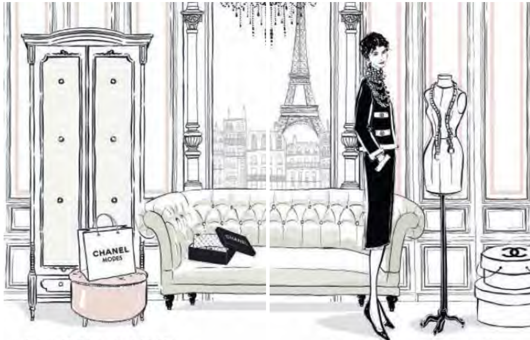
Situado junto a la Place Vendôme, muy de moda, y la Rue du Faubourg Saint-Honoré, Chanel Modes se encontraba en el corazón de París y en el centro de la alta costura parisina.