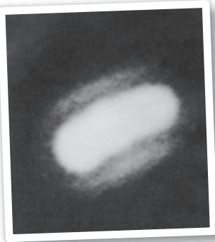
Ovni resplandeciente captado por José Luis González en la playa de La Tejita (Canarias).