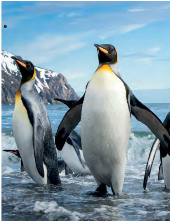
Las 101 maravillas del mundo