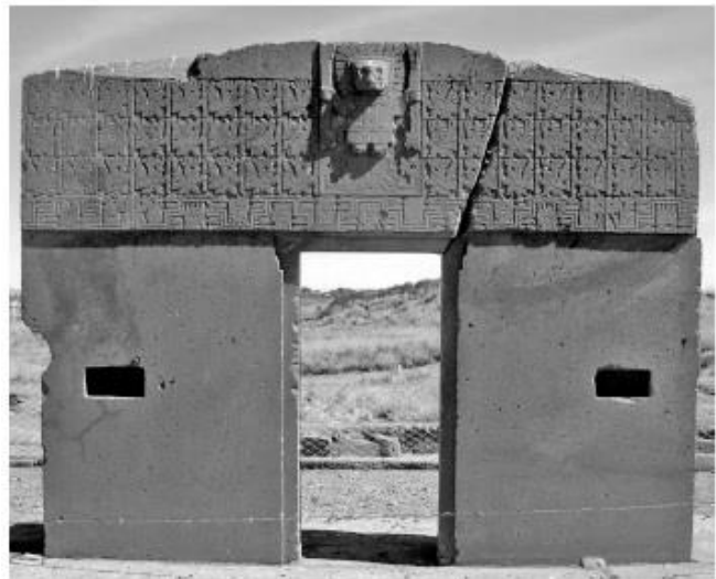
La Puerta del Sol, en Tiahuanaco, Bolivia.

Tierra II se adentra en ese hipnótico misterio. Si bien se trata de información delicada que ya he abordado en otras publicaciones, varios puntos quedaron en el tintero y siento que ahora es el momento de adentrarse en esa advertencia de los extraterrestres: la humanidad se encuentra en el final de un ciclo histórico y su supervivencia se halla atada a un gran viaje hacia otros planetas habitables más allá de nuestro sistema solar. Así de crudo. Mientras buena parte de nuestra sociedad vive dormida y atrapada en las garras de un mundo materialista e ilusorio, encadenada al miedo, a caballo entre conflictos bélicos, pandemias y entretelones políticos y económicos inabarcables, ese «escape» de la humanidad hacia otros astros ya se está planificando.