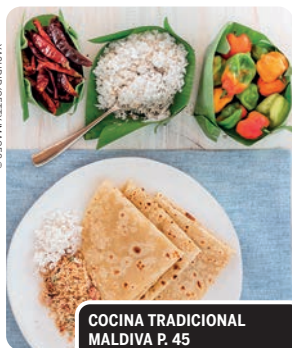
COCINA TRADICIONAL MALDIVA P. 45