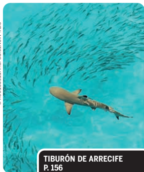
TIBURÓN DE ARRECIFE P. 156