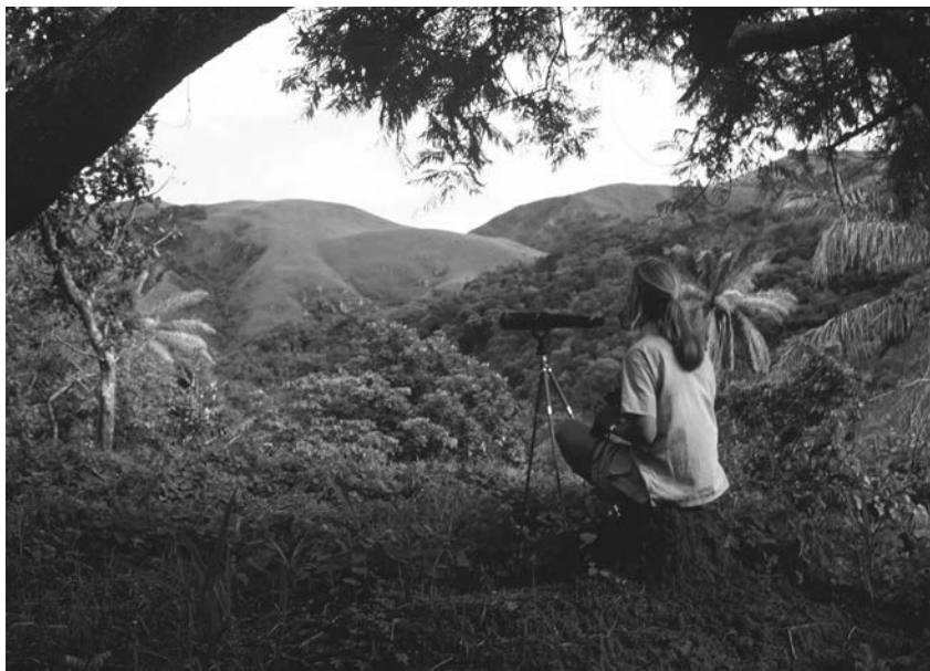
Fijé una cámara en un árbol y tomé una fotografía de mí misma en busca de señales de chimpancés.

Fue una suerte para Jane que Leakey pensara que las mujeres eran mejores investigadoras de campo: eran más pacientes y mos-