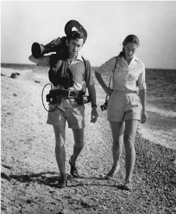
El pesado equipo con el que Hugo cargaba, una vieja cámara Bolex de 16 mm, en la playa de Gombe.

Jane recordó su primer matrimonio con la ecuanimidad que brindan casi cinco décadas desde su divorcio en 1974. Se volvió a casar, con Derek Bryceson, director de los parques de Tanzania,