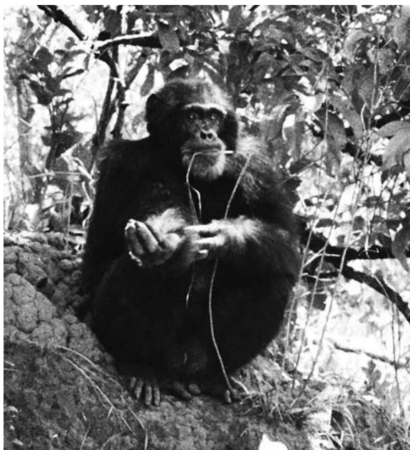
David Greybeard en un termitero, con una herramienta de hierba en la boca; imagen tomada justo después de contemplar, por primera vez, la pesca de termitas.

—David Greybeard y su herramienta lo cambiaron todo —recordó Jane—. National Geographic aceptó seguir financiando mi investigación cuando se acabó mi primera beca, y enviaron a Hugo a filmarlo todo. —Hugo van Lawick, el cineasta neerlandés que registró los descubrimientos de Jane, se convirtió en su primer marido—. Todo ocurrió gracias a que Louis sugirió que